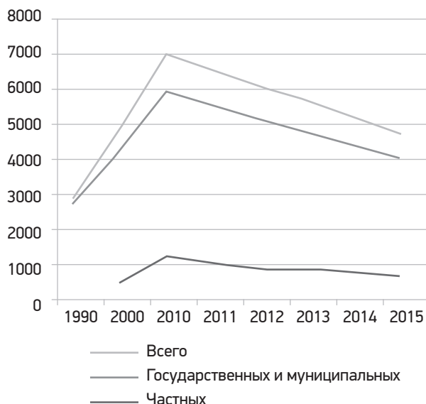
Рис. 2. Численность студентов, обучающихся по программам бакалавриата, специалитета, магистратуры в образовательных организациях высшего образования в России (тыс. чел.) 13